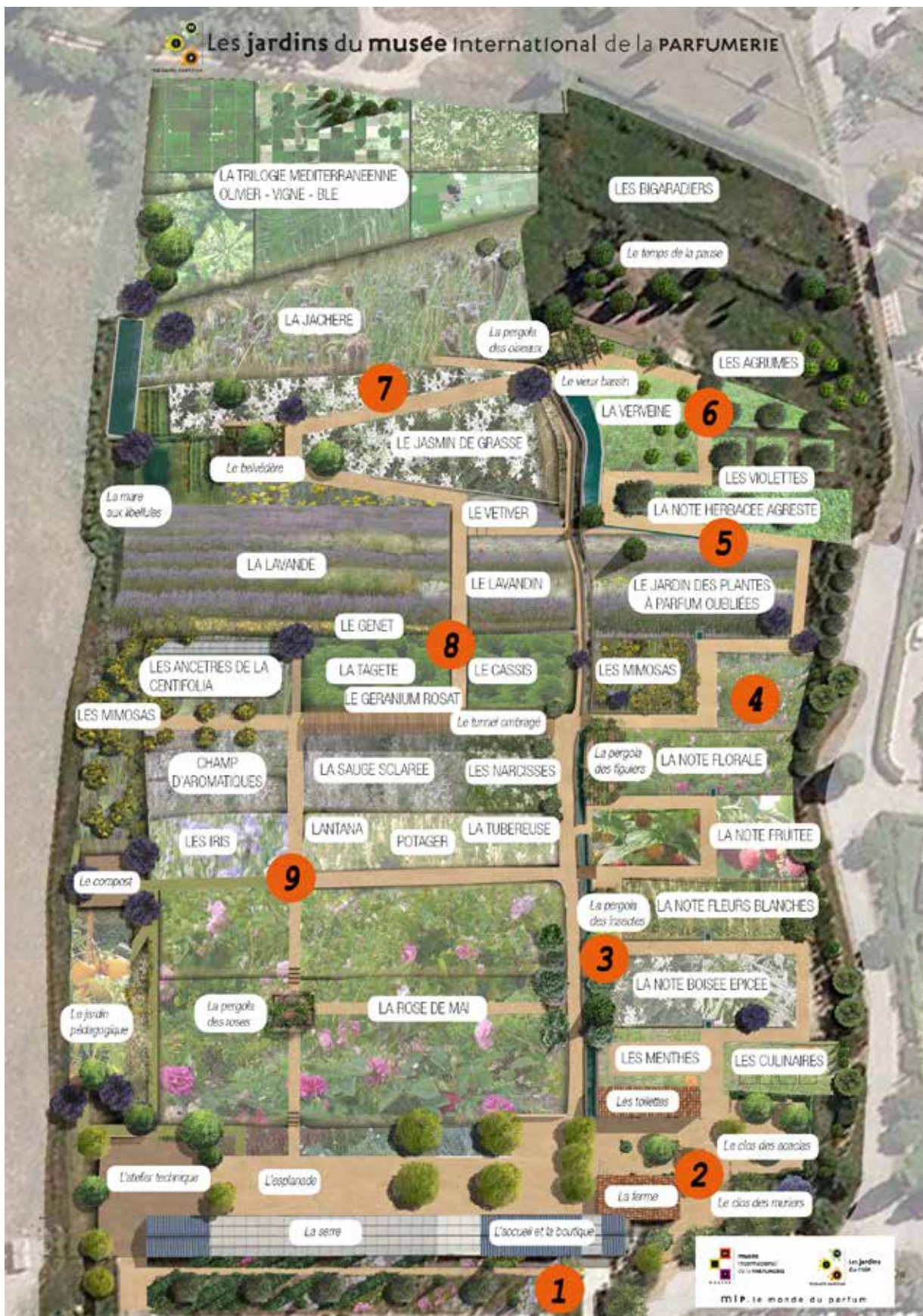
Emplacements susceptibles d'être légèrement modifiés